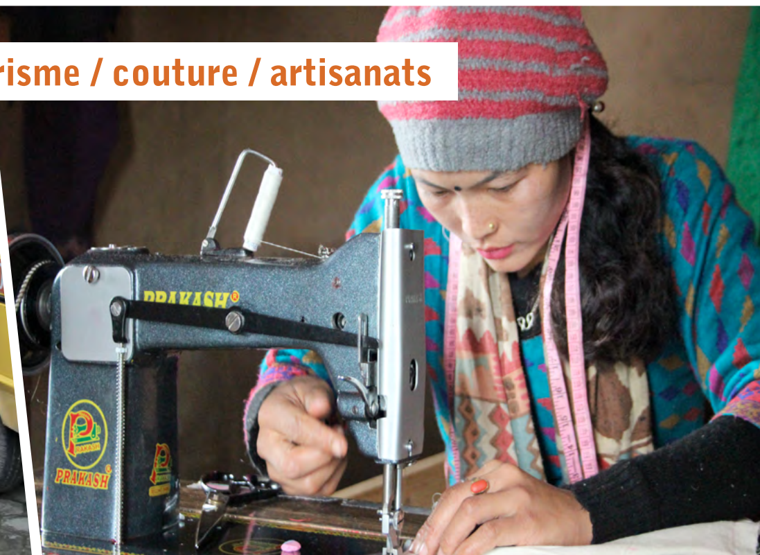
Formations tourisme / couture / artisanats