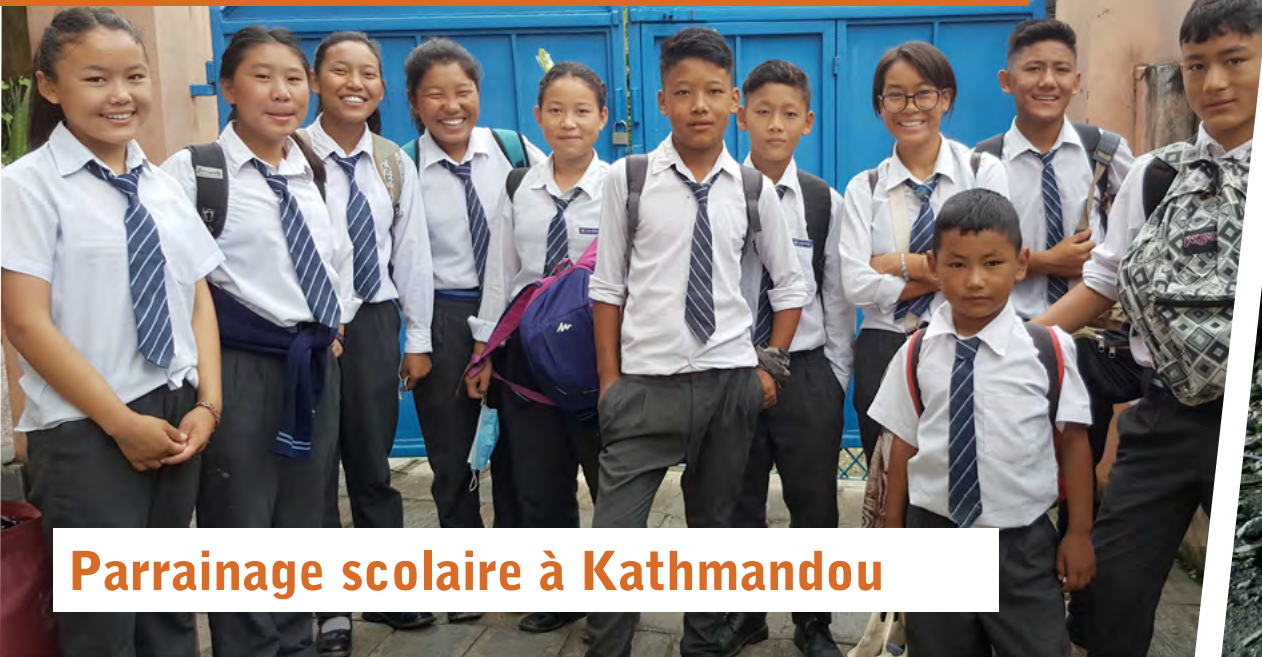
Parrainage scolaire à Kathmandou