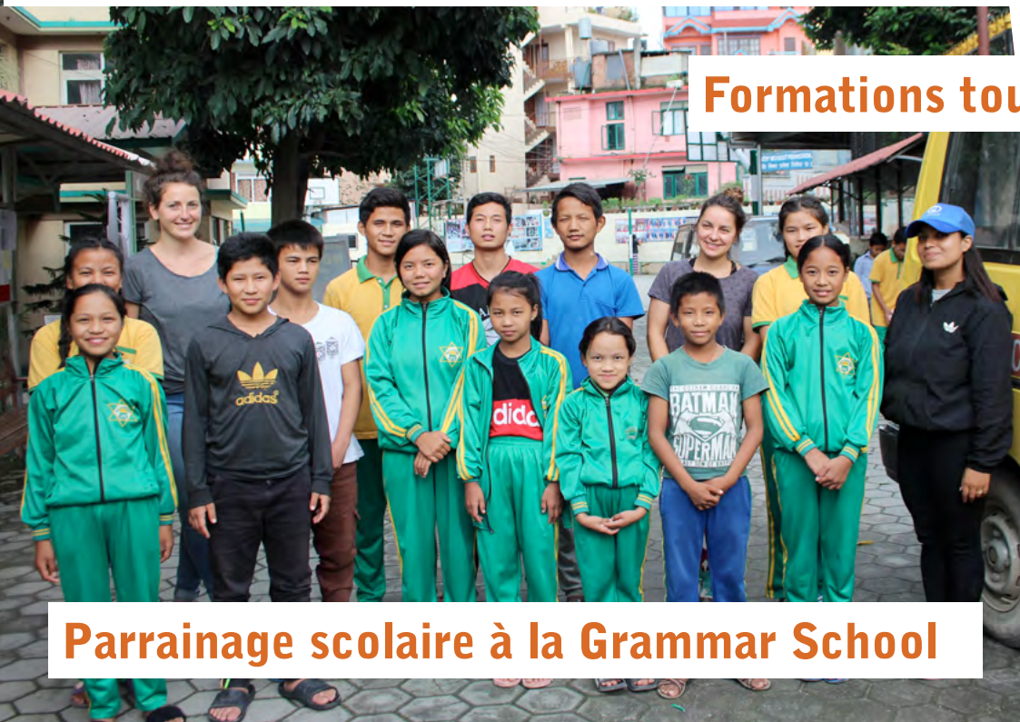
Parrainage scolaire à la Grammar School