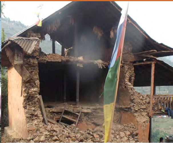
Reconstruction après le séisme en 2015