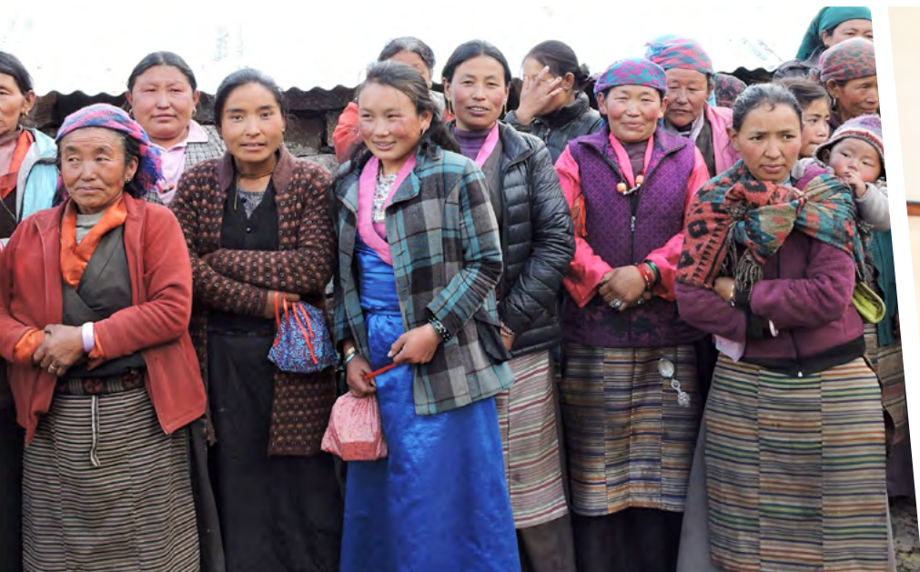
Maison des femmes et de l'artisanat Commercialisation des produits du tissage