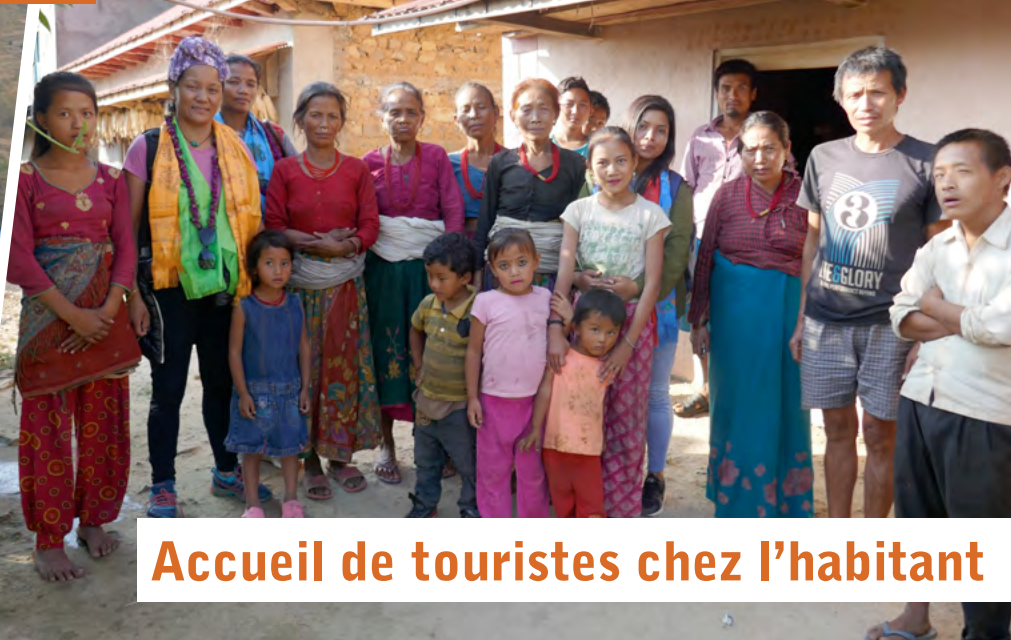
Accueil de touristes chez l'habitant