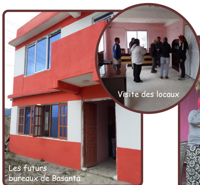
Les futurs bureaux de Basanta