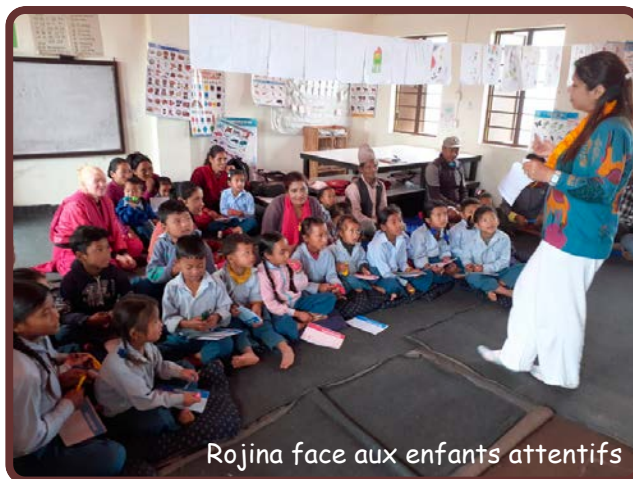
Rojina face aux enfants attentifs