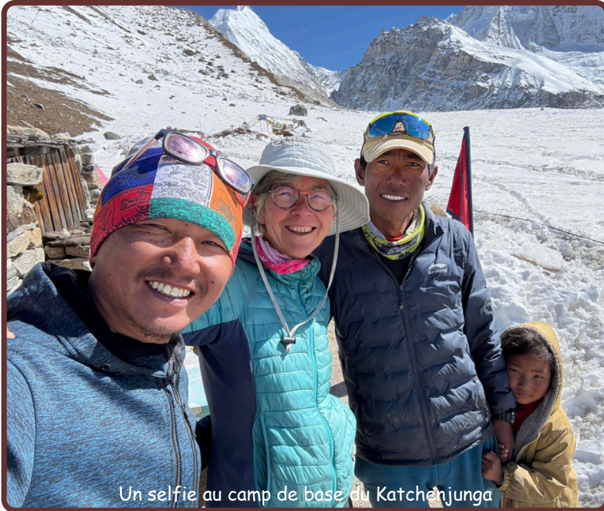
Un selfie au camp de base du Katchenjunga

Elle s'est octroyé un peu de repos, bien mérité, avant de rentrer en France fin novembre.