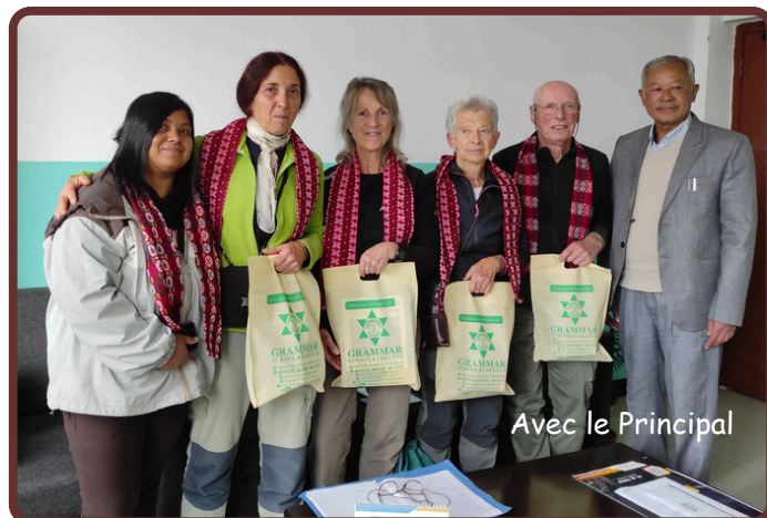
Avec le Principal