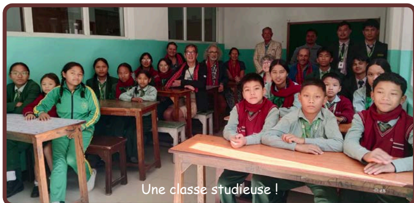
Une classe studieuse !