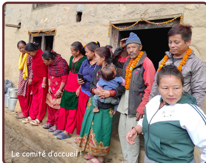
Le comité d'accueil !