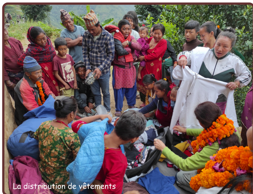
La distribution de vêtements