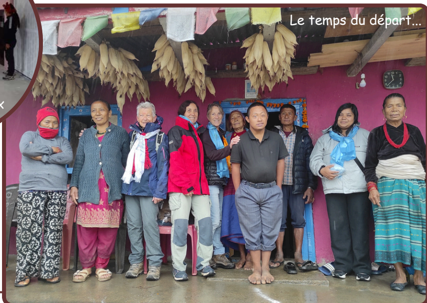
Le temps du départ...