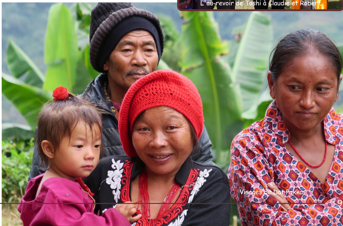
Visages de Dat Pakka